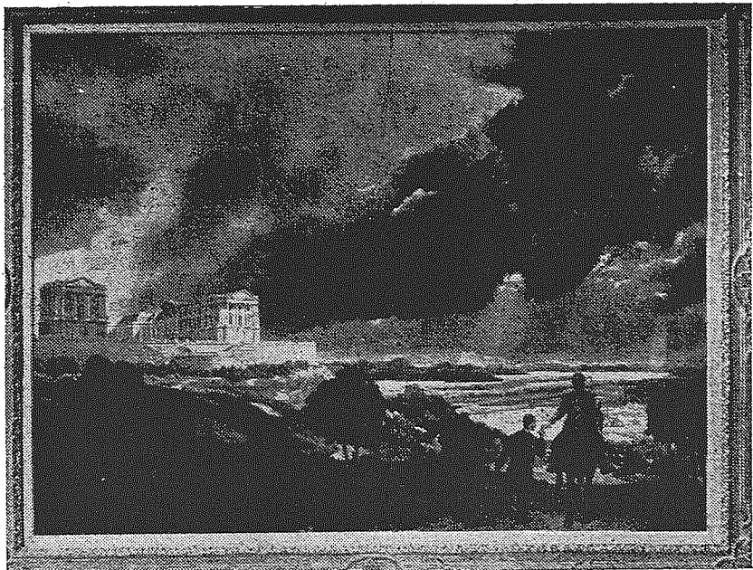
De Tijding 1943

"Een literair motief kan schilderij kunstig verwerkt worden. Rembrandt's schilderijen zijn dikwijls gebaseerd op bijbelgeschiedenissen, doch picturaal gezien. Het is dikwijls een kwestie van