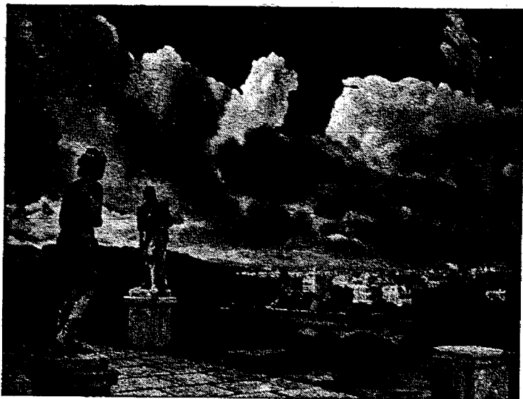
STADSGEZICHT 1944 DOOR A. C. WILLINK

„Ik geef toe, dat ze smal is, maar noemt U mijn schilder van deze tijd, die, zoals Rembrandt en Ver-lasquez, van een metaphysisch levensbeeld uit werkten. Picasso misschien? Of De Chirico? Deze schilders trokken te velde tegen een dode traditie, maar aan een eigen „hemel“ kwamen ze niet toe. Tot mijn verrassing verlaat De Chirico in zijn nieuwste werk zijn wonderlijke wereld en slaat hij de richting in van het realisme, van een romantische zakelijkheid. Ook deze, die in dit verband wel wordt genoemd, is nog te veel uit de school van de afbrekers. Niettemin geloof ik aan de mogelijkheid van een brede basis. De dreiging, waaraan we allengs gewend raken, wordt meer en meer opgenomen in ons wereldbeeld en daardoor zal zij minder tyranniek gaan op-treden.“